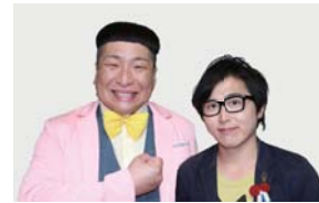
お笑い芸人 ペんぎんナッツ