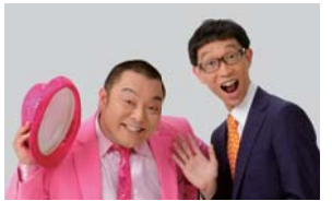
お笑い芸人 パチッコリン