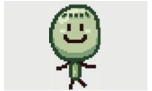
仙台つーんのライター ずんだ